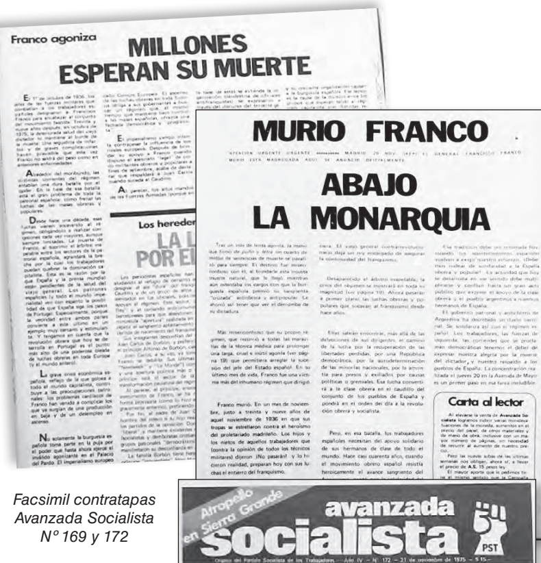
Facsimil contrapapas Avanzada Socialista N° 169 y 172

Después de cuatro años de guerra, el nazismo de Hitler fue aplastado. Se produjo un enorme triunfo democrático, uno de cuyos protagonistas principales fueron el pueblo soviético y el Ejército Rojo. La excepción fue la península ibérica, donde se mantuvieron las dictaduras de Franco y la de Caetano-Salazar en Portugal. La represión de aquellas década