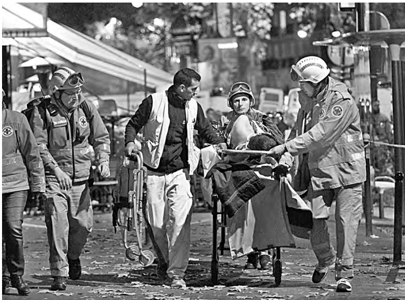
Imagen del atentado en París

El dictador Bashar al Asaad salió a declarar que también es responsable de lo sucedido el gobierno francés que "avalan al terrorismo" opositor contra su "legítimo gobierno". Esto es falso. Tanto Bashar como Francia y el imperialismo yanqui tienen su cuota de responsabilidad en estos atentados. En primer lugar, el de Bashar al Asaad no es un gobierno "legítimo" sino una dictadura que enfrenta desde 2011 una rebelión popular que fue parte de la "primavera árabe" iniciada en Túnez y Egipto. Desde entonces viene masacrando a su pueblo con tanques, bombardeos y armas químicas. Con el apoyo abierto del reaccionario Putin que