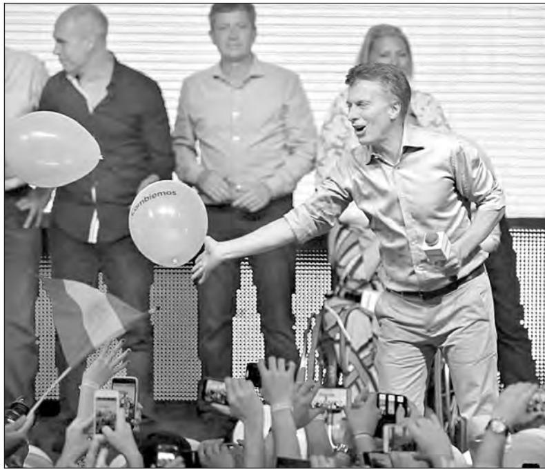
Tras los globos se encubren medidas antipopulares

Dice Macri: "el 11 liberamos el cepo cambiario". Para lograrlo buscaría acercar divisas a las reservas del Banco Central. ¿Cómo están planteando hacerlo? Muy simple: pidiéndole a los grandes pulpos exportadores que vendan los 6.000 millones de dólares que tienen "guardados" en silo-bolsas. Para esto les garantizarán un negocio fabuloso: el dólar oficial, hoy a 9 pesos, subirá hasta un monto difícil de definir (¿13, 14, 16 pesos?) y además les bajarán (o directamente eliminarán) las retenciones. Blanco sobre negro: multinacionales como Nidera, Cargill o Dreyfuss recibirán el doble de lo que ganan hoy por la misma tonelada exportada. Tenemos que tener en claro que, si esto sucediera, quienes pagarían el costo, como siempre, serán los bolsillos de