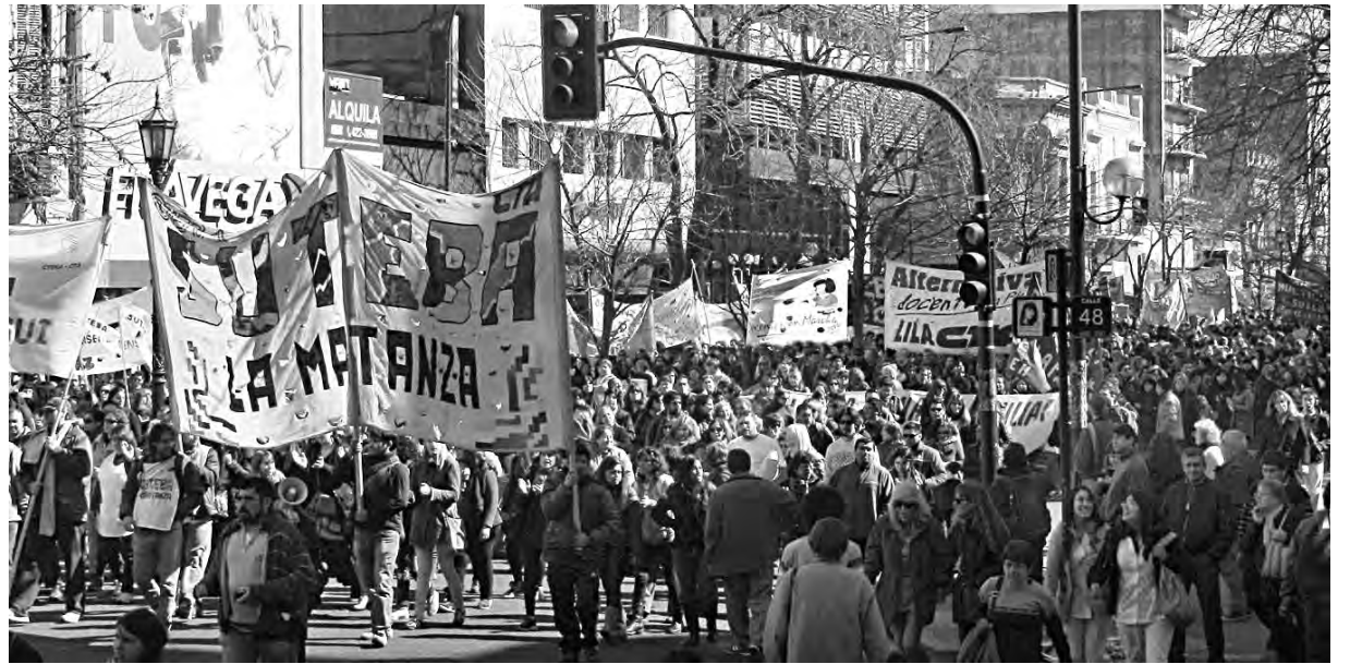
¡Todos a garantizar la jornada del 3!

Este planteo tuvo eco en diferentes sindicatos combativos de otras partes del país, como Ademys de CABA, Sutef de Tierra del Fuego y Adosac Pico Truncado, que plantearon la necesidad de unificar nacionalmente el reclamo hacia Cristina, los gobernadores y frente al nuevo gobierno de Mauricio Macri. Incorporando con fuerza la lucha contra la criminalización de la protesta, repudiando los juicios a los docentes y trabajadores de Tierra