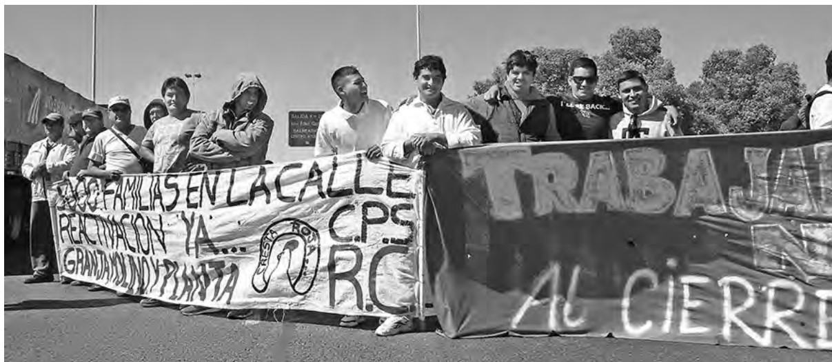
Trabajadores cortando la Richeri este martes reclamando soluciones

Cresta Roja tenía como principal cliente al gobierno de Venezuela, que tras un acuerdo con el gobierno kirchnerista, cambiaba pollos por petróleo. Ese acuerdo fue en realidad una nueva fiesta de sub-