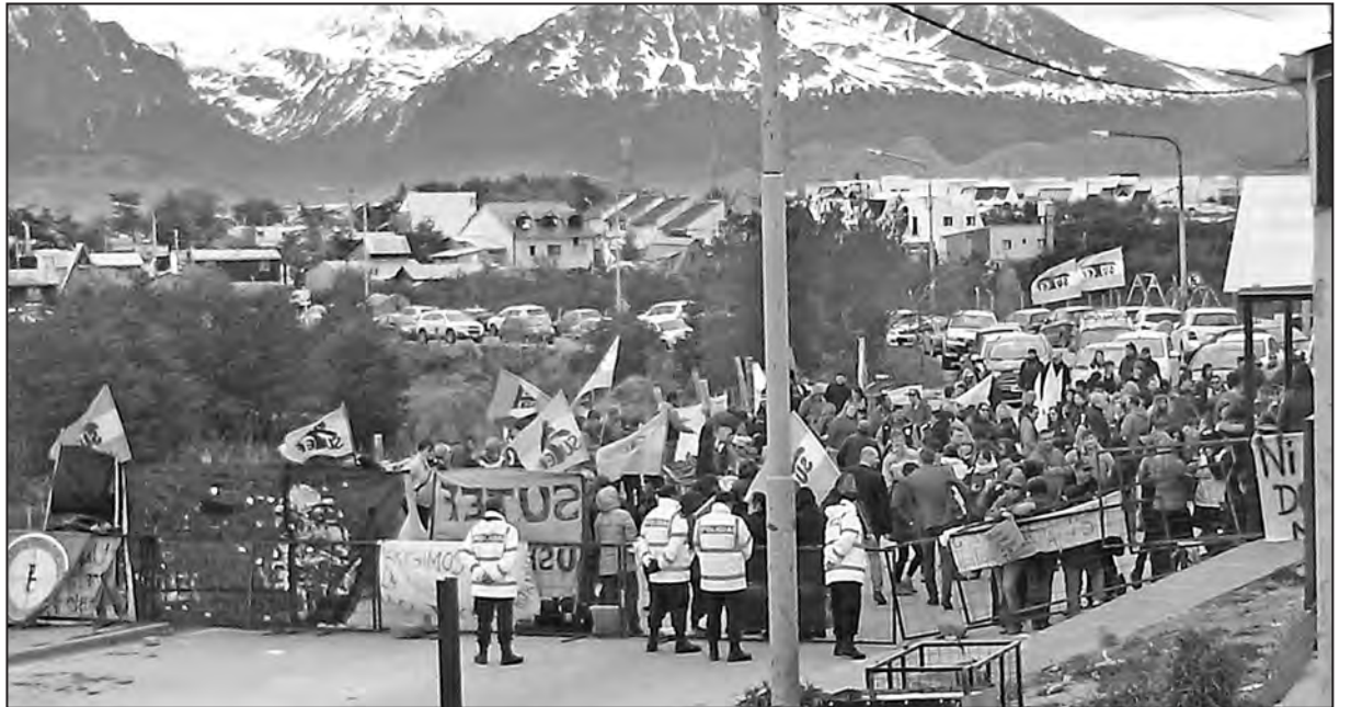
Concentración en Ushuaia exigiendo el cese de la persecución