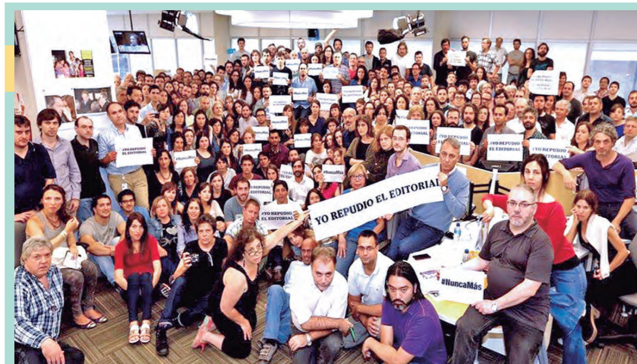
Asamblea de trabajadores de La Nación