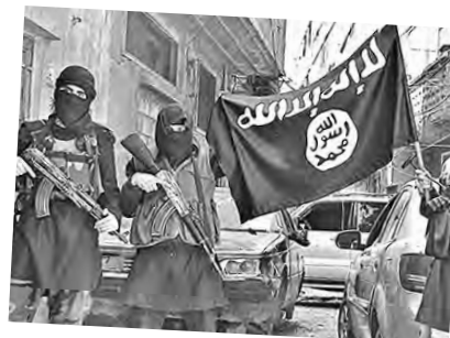
Milicia ultrareaccionaria del ISIS

El ISIS, que ha reclamado ser el autor de los criminales atentados en Francia, es un desprendimiento de